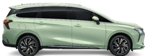
M4 zelena (črna streha)