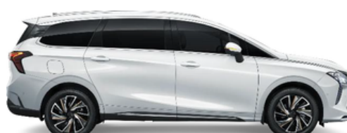
Bela (črna streha)