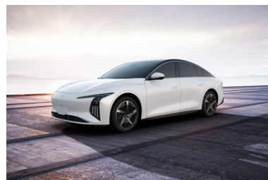
Bela (črna streha)