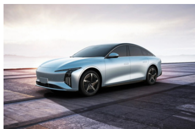
Svetlo modra kovinska